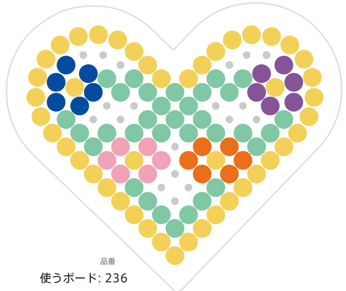
品番 使うボード: 236