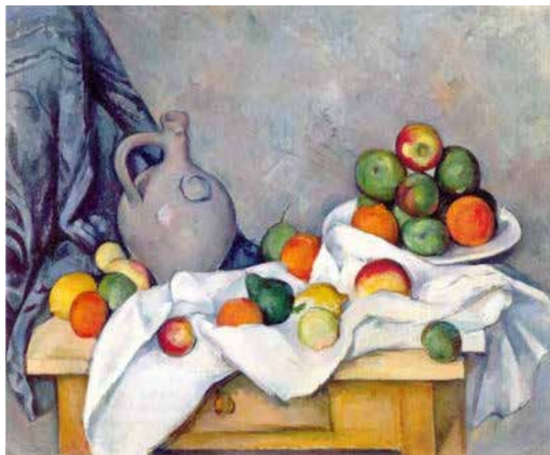
「カーテン、水差し、そして果物鉢」

世界的に有名な名画をハマビーズで描こう。 絵の具や色鉛筆などの画材とは違った味わいが生まれます。