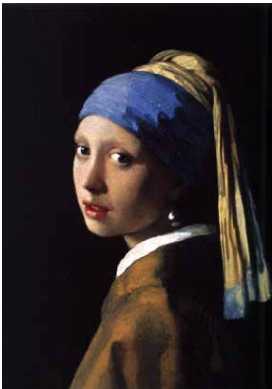
「真珠の耳飾りの少女」

世界的に有名な名画をハマビーズで描こう。 絵の具や色鉛筆などの画材とは違った味わいが生まれます。